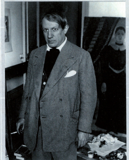
PABLO PICASSO, EN EL ESTUDIO DE RUE LA BÔTIE, FRENTE AL RETRATO DE YADWIGHA DE HENRI ROUSSEAU, PARÍS, 1932. GELATINA DE PLATA, 28,1 X 21,8 CM.